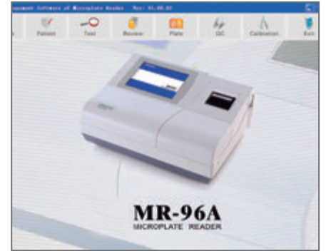
Data Management Software